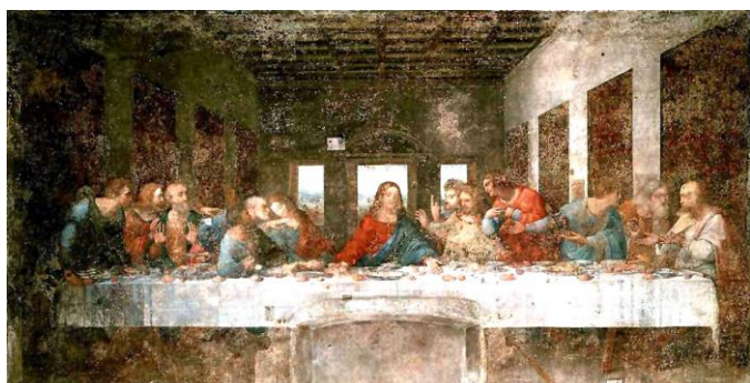
Het Laatste Avondmaal

U kunt uw giften overmaken op rekeningnummer NL45 RABO 0308 4012 39 t.n.v. College van Kerkrentmeesters PGB